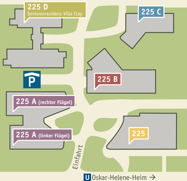
CLAYALLEE 225 A–D

Auf dem ehemaligen Gelände des Oskar-Helene-Heims in Berlin-Zehlendorf ist ein in Deutschland bisher einzigartiges, innovatives Gesundheits- und Medizinkonzept entstanden: Das „eins – alles für die Gesundheit.“ Auf einer Fläche von über 16.000 qm arbeiten Ärzte aus unterschiedlichen Disziplinen sowie medizinischen Einrich-